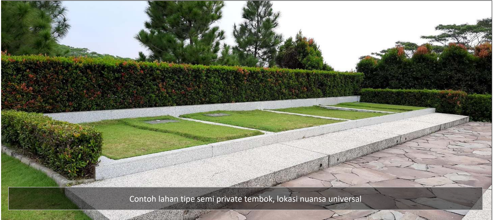
Contoh lahan tipe semi private tembok, lokasi nuansa universal