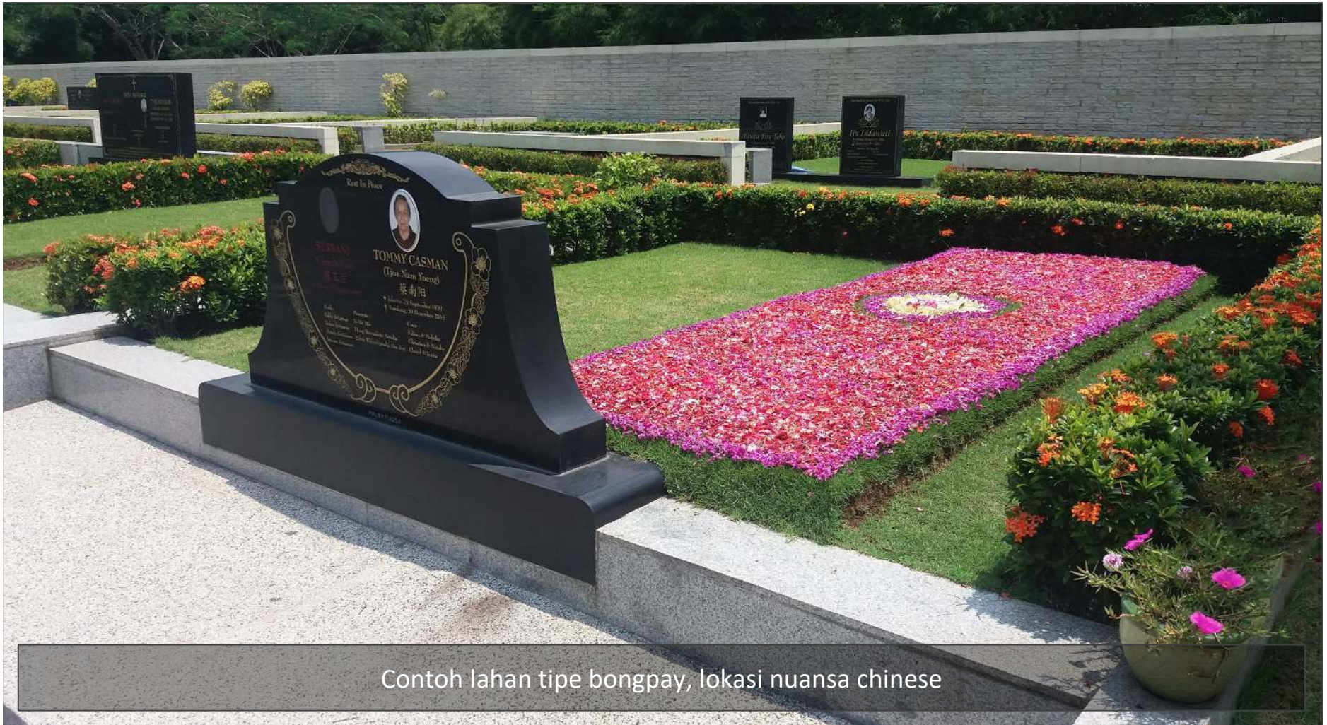
Contoh lahan tipe bongpay, lokasi nuansa chinese