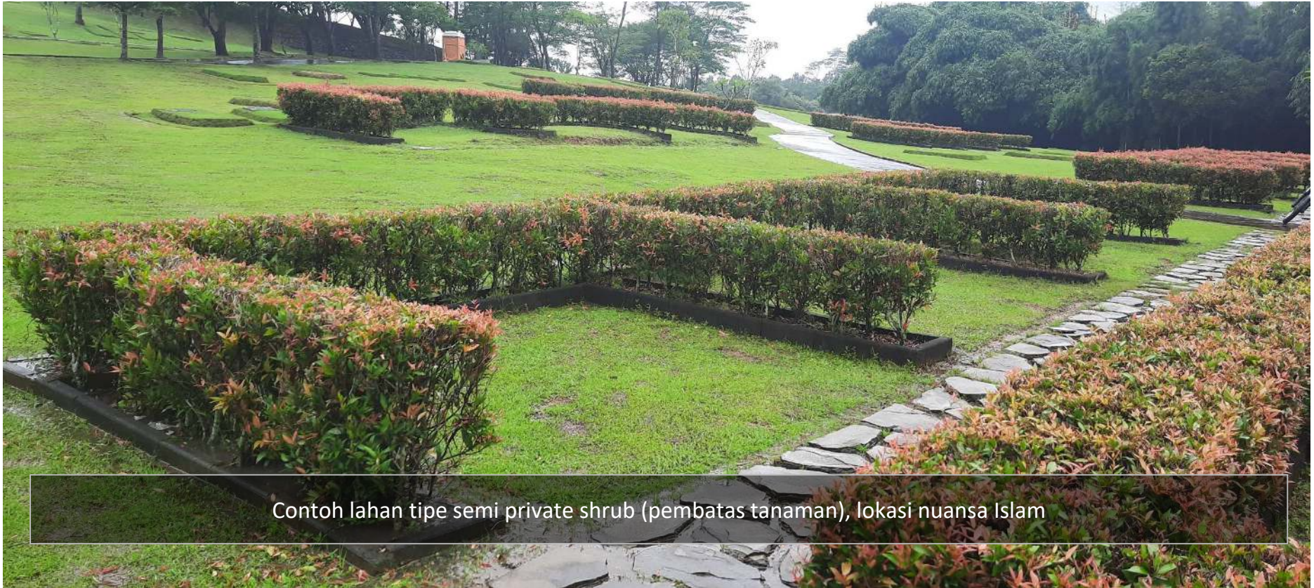
Contoh lahan tipe semi private shrub (pembatas tanaman), lokasi nuansa Islam